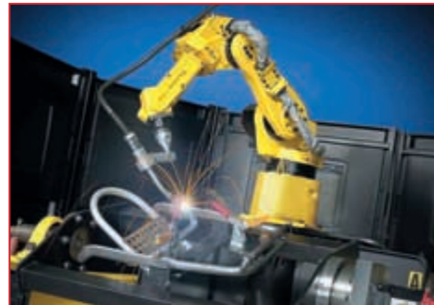
Spezialisten mit Serienerfahrung: Alle neuen Robotertypen basieren auf Modellen der Großserie und bringen deren positive Eigenschaften mit.

kaum Flexibilität. Der Roboter hat eine Reichweite von 3,5 m und damit deutlich mehr als die Standardversion des R-2000iA. Damit verkettet der Roboter Pressen mit einem Abstand von bis zu etwa fünf Metern schnell, flexibel und wirtschaftlich. Nicht zuletzt aufgrund des großen Interesses bei PSA hat man diesen Robotertyp in relativ kurzer Zeit entwickelt.