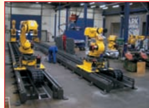
Solide Basis: Eine Spezialität von rcs/FSM sind exakt angepasste Verfahrsschienen für Roboter.

»Wenn man in der ersten Liga mitspielen will, muss man die technischen Voraussetzungen ha-