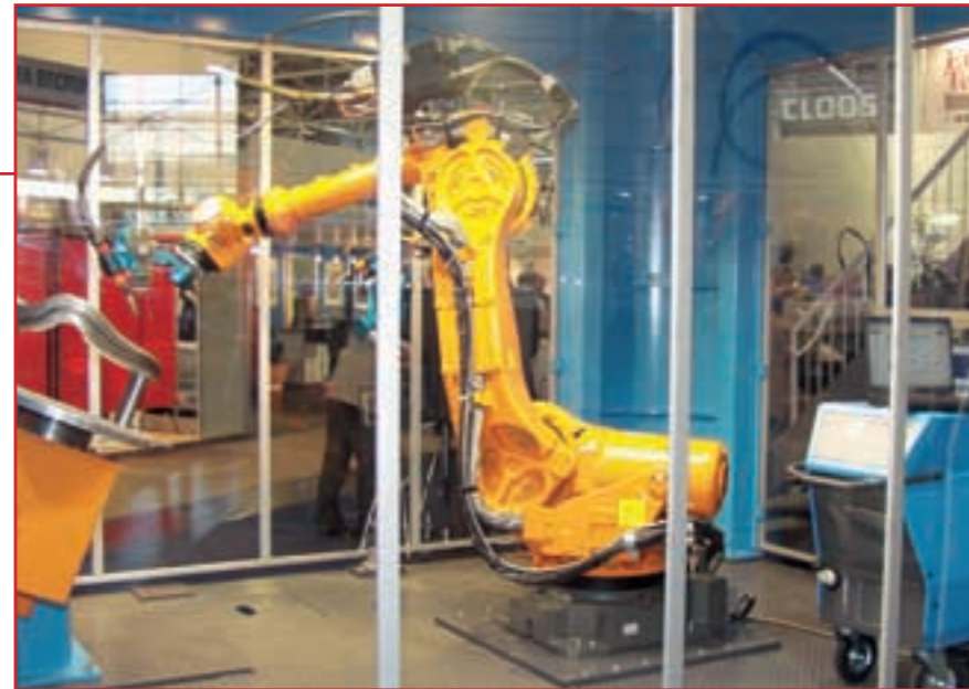
Die hohen Schweißgeschwindigkeiten von mehreren Metern pro Minute sind für Automobil- und Zulieferindustrie interessant.

Darüber hinaus werden zusätzliche positive Effekte erzielt. Insbesondere ein »Knackpunkt« lässt sich mit dem Hybridverfahren elegant umgehen: Es bilden sich nämlich viel weniger Risse und Poren, beispielsweise hervorgerufen durch den Einstich des Lasers am Beginn einer Schweißnaht. Zudem ist die Nahtfestigkeit höher, weil das Schweißgefüge gezielt beeinflusst werden kann. Der Aufwand an Nacharbeit sinkt, weil (im Vergleich zum herkömm-