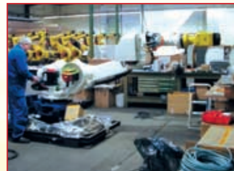
Ganz wie gewünscht: Beim Automotive erfahrenen Systemhaus werden Roboter nach Bedarf umgerüstet.

Ganz intensiv hat rcs die Qualifizierung seiner Mitarbeiter in Sachen Robotertechnik betrieben. Umgekehrt rüstet das Service-Team Roboter entsprechend Kundenvorgaben um, »qualifiziert« damit Roboter beispielsweise für den Rohbau des Golf V. Natürlich sind Drenkelfort geplante Servicetermine lieber: »Aber wenn es brennt, sind wir eben da.«